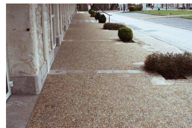
10/16 Roulé Jaune